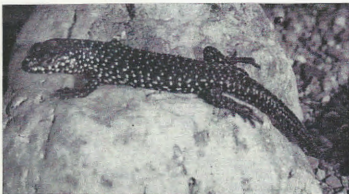
Abb. 2. Egernia cunninghami ; sieben Tage alt. \times 0,8 . Egernia cunninghami ; seven days old specimen.

nia verblieben zum Teil mehrere Stunden im Terrarium der adulten, ohne daß ihnen von diesen nachgestellt worden wäre. Attrappenversuche sollen hier noch Klärung bringen.