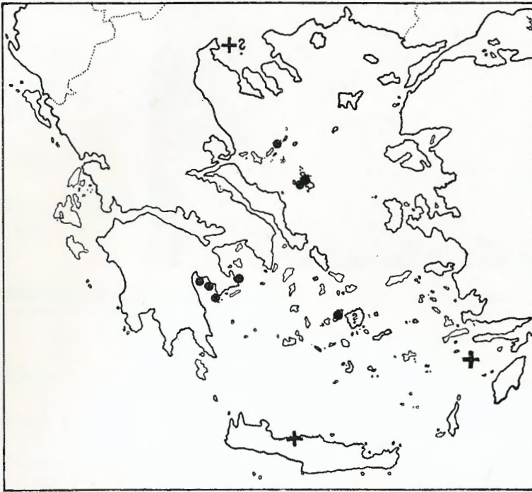
Abb. 3. Bekannte Vorkommen von Testudo marginata ; ● = rezent, + = fossil, ? = fraglich.

Known distribution of Testudo marginata ; ● = recent, + = fossil, ? = doubtful.