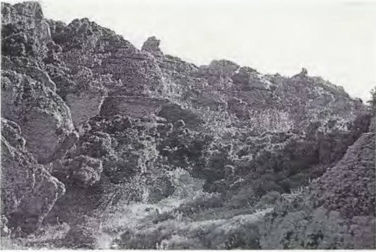
Abb. 1. Lebensraum von Testudo marginata auf der Insel Skyros, Nördliche Sporaden. — Aufn. G. STORCH.

Habitat of Testudo marginata on Skyros Island, Northern Sporades.