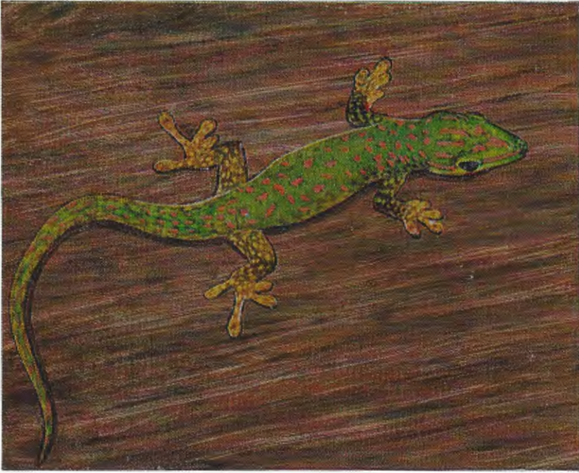
Abb. 1. Phelsuma guttata . Zu beachten sind der für Phelsumen ungewöhnlich lange Schwanz bei sehr schlankem Körper und die gepunkteten Vorder- und Hinterbeine.

Phelsuma guttata . In this species the tail seems unusually long, the body slender, and the fore- and hind-limbs are spotted.