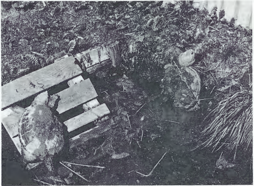
Abb. 2. Chelydra serpentina serpentina , sich außerhalb des Wassers sonnend. ♂ 1 links, ♂ 2 rechts.

CONANT (1975) schreibt zu Chelydra serpentina : „Snappers rarely bask“. Dies kann ich nicht bestätigen. Es vergeht kein sonniger Tag, an dem meine Tiere nicht das Wasser verlassen, um sich bis zu mehreren Stunden täglich zu sonnen. Geraten sie dabei im Verlauf des Tages in den Schatten, so gehen sie zurück ins Wasser, um an anderer Stelle des Ufers das Sonnenlicht wieder aufzusuchen. Uferschrägen, Bodenunebenheiten sowie die Holzrampe werden genutzt, um eine günstige Position zum einfallenden Sonnenlicht einzunehmen (Abb. 2). Die für viele Angehörige der Emydidae typische Sonnhaltung mit ausgestreckten Hinterbeinen und gespreizten Zehen, konnte ich, wie auch EWERT (1976), bei Chelydra s. serpentina nicht beobachten.