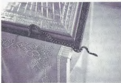
Abb. 2. Telescopus fallax kriecht auf dem Rand der religiösen Darstellung herum auf dem Pult in der Kirche von Argínia. Telescopus fallax crawling on the edge of the religious image in the church of Argínia.

(nach Marco Polo) nur zwischen dem 6. und 15. August erscheinen und dann gefangen und zur Kirche gebracht werden. Im weiteren Jahresverlauf sollen die Tiere nie beobachtet werden. Außerdem sollen sie anderen Teilen Kefallinias fehlen. Es wurde gesagt, daß die Schlangen gefährlich, das heißt giftig sind, sobald sie die Kirche am 15. August wieder verlassen haben. Auf welche Weise die Tiere die Kirche verlassen können, blieb unklar. Zwischen dem 6. und 15. August wäre das Berühren der Schlangen durchaus ungefährlich oder gar empfehlenswert, weil es sich auf verschiedene Leiden recht positiv auswirken sollte. Die Schlangen seien eben heilige Tiere, was auch durch ein Kreuz am Kopf ersichtlich sei, so wurde gesagt (Anonymus 1973). Demnach handelt es sich um ehemalige Nonnen eines von Seeräubern heimgesuchten Klosters, die