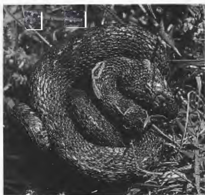
Abb. 8. Natrix maura vom Rio Douro in Ballstellung. Natrix maura from Rio Douro coils into „ball“.

Ein adultes Exemplar durchschwamm den Rio Douro an einer circa 500 m breiten Stelle.