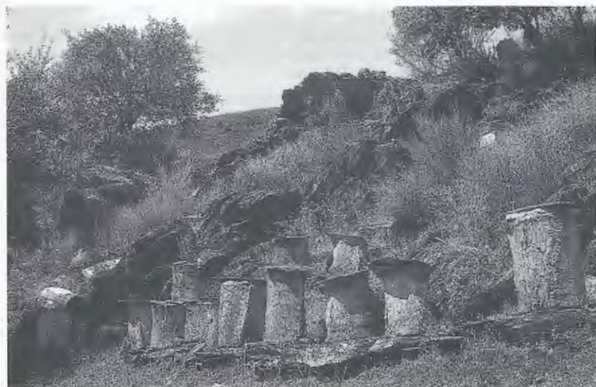
Abb. 3. Schieferbruchstücke bei Mós, mit Bienenstöcken. Habitat von Podarcis hispanica und Tarentola mauritanica .

Fragments of argillaceous slate near Mós, with beehives. Habitat of Podarcis hispanica and Tarentola mauritanica .