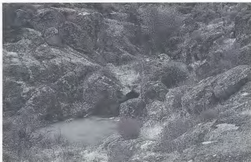
Abb. 2. Bach bei Larinho (Felsburgenlandschaft). / Brook near Larinho („area of castlelike granite blocks“). Habitat von/of Natrix maura , Triturus marmoratus , Alytes cisternasii , Rana perezi .