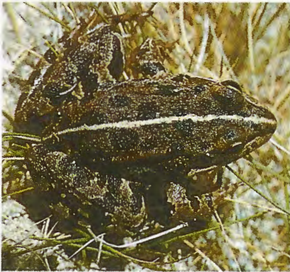
Abb. 6. Rana perezi aus/from Larinho.