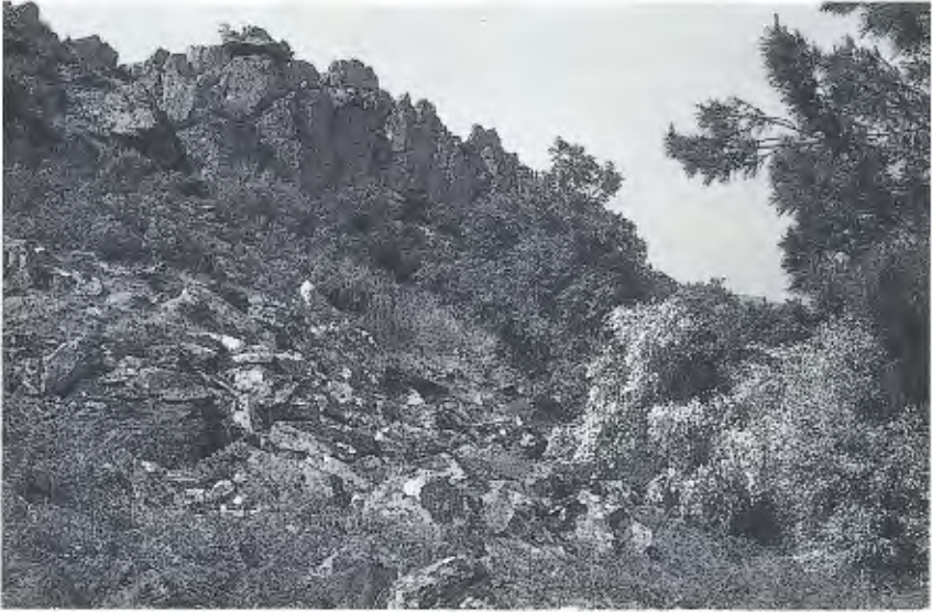
Abb. 4. Serra do Reboredo. Habitat von/of Lacerta lepida , Blanus cinereus , Chalcides bedriagai .

getation befindet sich nur noch relikthaft im Douro-Canyon in Form von Restwäldern, in denen Zürgelbaum ( Celtis australis ), Wacholder ( Juniperus oxycedrus ) und Steineiche ( Quercus ilex ) dominieren.