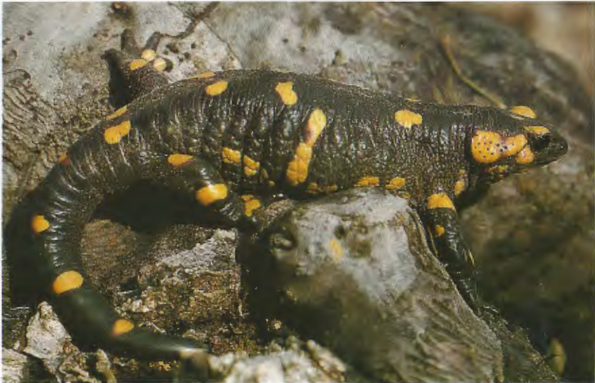
Abb. 5. Salamandra salamandra gallaica aus/from Freixo.

Auf die hohe Verbreitungsdichte und lokale Individuenmassierung dieser Art in NE-Portugal habe ich bereits hingewiesen (MALKMUS 1983). Präferenzräume zur Eiablage sind vornehmlich Stillwasserzonen in Bächen (Kolke, sehr langsam fließende Bereiche) und Brunnenschächte, selbst albercas (Fließwasserbrunnen), die als Waschstellen verwendet werden (z. B. bei Freixo). Bei Larinho fanden sich