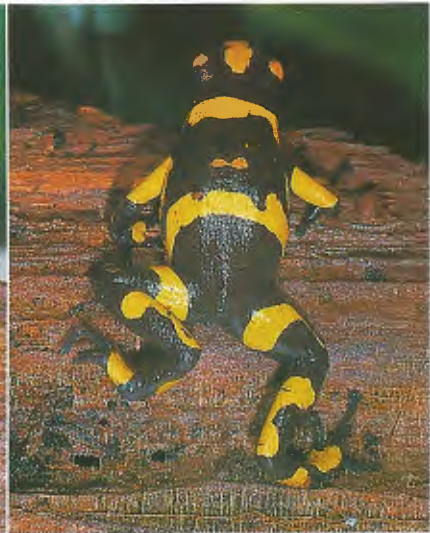
Abb. 3. Neue Form 2. / New morph 2.