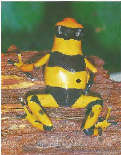
Abb. 2. Neue Form 1 mit breiten gelben Streifen. New morph 1 with broad yellow stripes.

Die Ergebnisse der elektrophoretischen Untersuchungen sind aufgrund der geringen Anzahl der untersuchten Exemplare nur begrenzt aussagefähig. Die Interpretation der Elektropherogramme bezieht sich auf die Bandenmuster an sich; eine Analyse der Serumproteine wurde nicht vorgenommen.