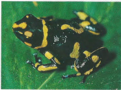
Abb. 6. Kreuzung von Dendrobates histrionicus und D. lehmanni .

Die morphologischen Ergebnisse zeigen, daß das Farb- und Zeichnungsmuster von Form 1 und D. lehmanni ineinander übergehen. Die Areale dieser beiden Varianten grenzen sogar an einer Stelle unmittelbar aneinander (Abb. 1). Beim Sammeln hatte ich den Eindruck, daß in diesem Überlappungsgebiet fast nur intermediäre, orangefarbene Frösche vorkommen, die von der Breite der orangefarbenen Streifen her aber eindeutig der Form 1 entsprechen.