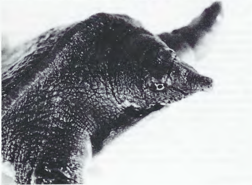
Abb. 3. Kopf und Halsregion a) von Rafetus swinhoei (NMW 30911) und b) Pelodiscus sinensis (lebendes Jungtier). Head and neck of a) Rafetus swinhoei (NMW 30911) and b) Pelodiscus sinensis (live juvenile).