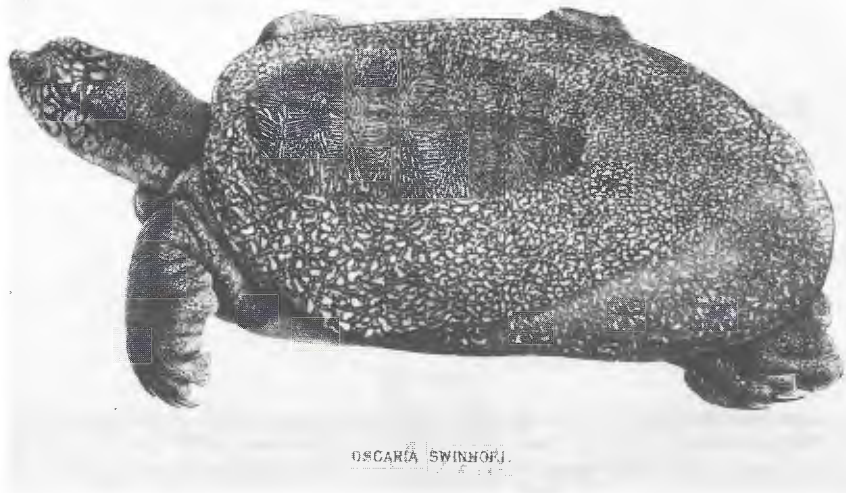
Abb. 1. Rafetus swinhoei aus/from GRAY (1873).

1977) bei der Bestimmung oder Neu-Bestimmung von Schildkröten in Anspruch genommen, so daß anzunehmen ist, daß recht viele Exemplare nur „administrativweise“ neu als „ sinensis “ etikettiert wurden. Deren richtige Identität kann erst dann mit Sicherheit bestimmt werden, wenn das Material der Sammlung des betreffenden Museums sorgfältig überprüft worden ist.