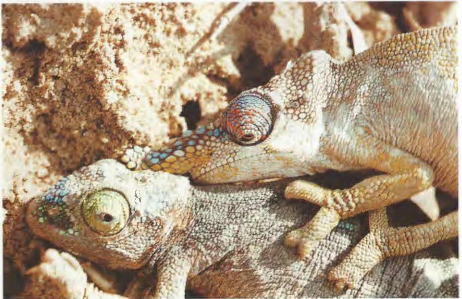
Abb. 4. Bradypodion oxyrinum während des Versuches zu kopulieren. Bradypodion oxyrinum attempting to copulate.

Während eines Kopulationsversuches färbte sich das Paar besonders intensiv (Abb. 4). Diese Farben sind aber auch bei sich sonnenden Chamäleons gut erkennbar, treten jedoch in Kopulationsstimmung besonders markant hervor. Beim Männchen zieht sich dann dorso-lateral ein schmaler, intensiv gefärbter