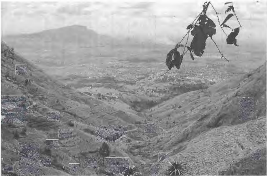
Abb. 1. Blick von Morningside auf die kultivierten Flächen der Uluguru-Berge. Cultivated land of the Uluguru Mountains viewed from Morningside.

Der Fundort der beiden 1899 in den Uluguru-Bergen entdeckten B. oxyrhinum lautet häufig nur: Ukami, Uluguru-Berge (TORNIER 1900, BARBOUR 1911, BARBOUR & LOVERIDGE 1928). Diese Angabe ist nicht sehr exakt, denn sie umfaßt ein großes Verwaltungsgebiet innerhalb der Region Morogoro, die Savannen- und Berglandschaften einschließt. Deshalb lassen sich daraus keine Hinweise auf den Biotop ableiten. Auch der Zusatz „Mkoyo in Ukami“ (WERNER 1902) half nicht viel weiter. Dieser Ort war weder auf entsprechenden Karten zu finden, noch den in den Uluguru-Bergen Ansässigen bekannt.