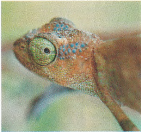
Abb. 5. Portrait eines weiblichen Bradypodion oxyrhinum .

Das Weibchen ist unscheinbarer gefärbt. Seine Grundfarbe ist grau bis bräunlich. Im Schnauzenbereich sind viele Schuppen kräftig blau bis türkis gefärbt (Abb. 5). Das Augenlid ist grün, auf dem Helm konzentrieren sich unregelmäßige blaue Punkte. Diese treten dann auch noch vereinzelt am restlichen Körper auf. In der Lendengegend kann man konzentrierter grüne Schuppen sehen.