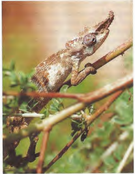
Abb. 3. Männliches Bradypodion oxyrinum . Das Ende des Schnauzenfortsatzes ist beweglich.

Male Bradypodion oxyrinum ; the end of rostrale projection is movable.