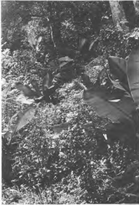
Abb. 2. Im Regenwald der Uluguru-Berge sind die wilden, endemischen Bananen ( Ensete uluguruensis ) zu finden. Habitat von Bradypodium oxyrhinum , B. fischeri uluguruensis und Chamaeleo weneri .

Euphorbia usambarica , Bridelia brideliifolia , Crassocephalum mannii , Conyza newii und Vernonia adoensis (POCS 1976) (Abb. 2).