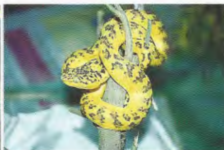
Abb. 4. Trimeresurus flavomaculatus mcgregori .