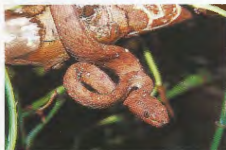
Abb. 3. Männchen (A) von / Male (A) of T. f. halieus .

Trimeresurus f. flavomaculatus (GRAY, 1842) (Abb. 1): Schwarze und andere dunkle Pigmente sind in der Körperfärbung vorhanden, die gewöhnlich grün ist. Entlang der untersten Schuppenreihe befindet sich eine deutliche, gelbe oder gelbgrüne Reihe von Flecken, die manchmal auch einen ununterbrochenen Streifen bildet. Der Schwanz ist braun gebändert.