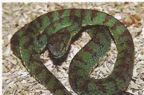
Abb. 1. Grünes Weibchen von Trimeresurus flavomaculatus , das eventuell der Nominatform zuzuordnen ist. Green female of Trimeresurus flavomaculatus , possibly of the nominate subspecies.