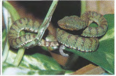
Abb. 9. Jungtier von T. f. halieus im Alter von 6 Monaten.

Hatchlings of T. f. halieus , incubated by the female.