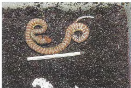
Abb. 6. Frisch geschlüpfter T. f. halieus , im Inkubator erbrütet. Hatchling of T. f. halieus , reared in an incubator.