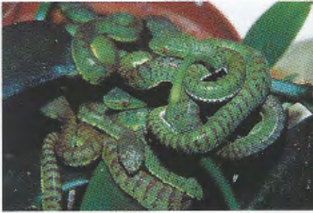
Abb. 8. Gruppe Jungtiere von T. f. halieus , Eier vom Muttertier bebrütet.

Hatchlings of T. f. halieus , incubated by the female.