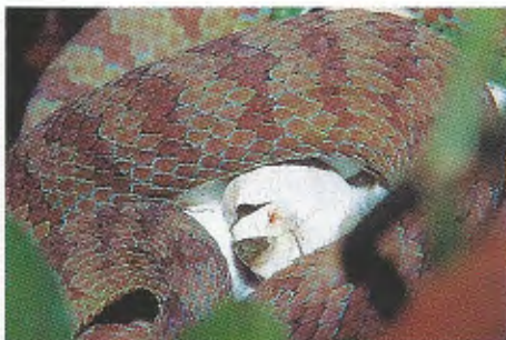
Abb. 7. Jungtier beim Schlupf, von Weibchen (A) ausgebrütet. Young snake hatching, incubated by female (A).