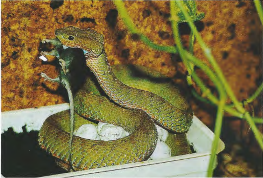
Abb. 10. Weibchen (B) frißt beim Brüten eine adulte Labormaus. Female (B) feeding on an adult mouse during breeding.

In der Färbung unterschieden sich die Nachzuchttiere von 1992 von denen von 1991. Die ersten waren rotgelb oder fast einfarbig grün, während die zweiten eine grüne Grundfärbung mit mehr oder weniger deutlichen braunen Flecken hatten (vgl. Abb. 6 und 9).