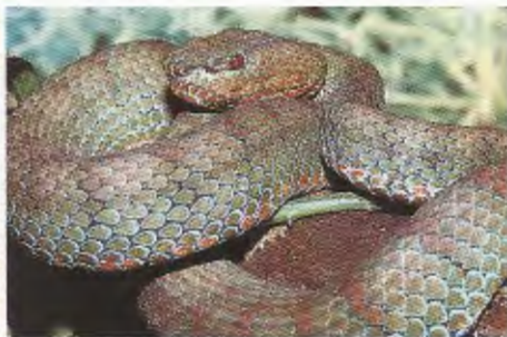
Abb. 2. Weibchen (B) von / Female (B) of Trimeresurus flavomaculatus halieus .

erfolgen, das zur Zeit in Arbeit ist (DAVID, VOGEL & INEICH, in Vorb.). Derzeit sind neben der Nominatform von T. flavomaculatus noch die Unterarten T. f. halieus und T. f. mcgregori valid.