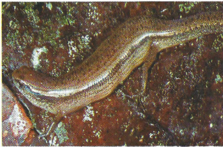
Abb. 1. Amphiglossus melanopleura , trächtiges Weibchen aus An'Ála (bei Andasibe) gravid female from An'Ála (near Andasibe).

Am 20.12.1994 fingen wir bei An'Ala (Umgebung von Andasibe) im primären Regenwald ein trächtiges Weibchen von A. melanopleura , das tagsüber in der Laubstreu aktiv war (Abb. 1). Das Tier, das im Zoologischen Forschungsinstitut und Museum Alexander Koenig (Bonn) unter der Sammlungs-