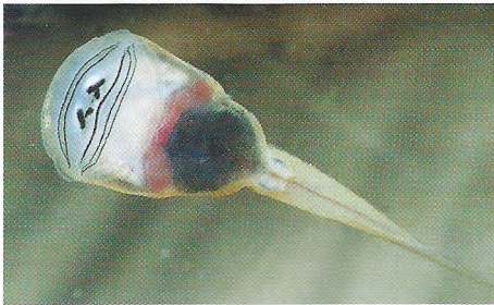
Abb. 3. Larve von Ansonia guibei , Mesilau East, 1860 m.

Unter den bisher bekannten Ansonia -Larven (vgl. INGER 1960, 1966, 1985, 1992) weist die hier beschriebene die größte relative Breite des Mundfeldes und zusammen mit A. leptopus die relativ kleinste Lücke zwischen den Oberkieferhälften auf; die in der Körperlängsachse gemessene Länge des Mundfeldes erreicht fast die Hälfte der KRL.