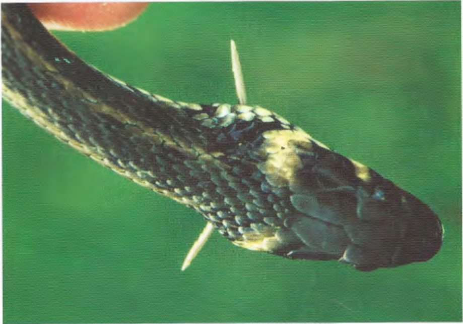
Abb. 1. Durch Nahrung verletztes Ringelnatter-Weibchen. Female grass snake, injured by feeding.