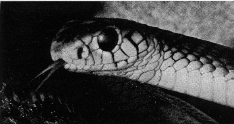
Abb. 2 Pseudohaje goldii . Kopf- und Halspartie. Pseudohaje goldii . Part of head and neck.

Das Flüssigkeitsbedürfnis von Pseudohaje goldii ist, bei einer rel. Luftfeuchte von 30–60%, verhältnismäßig groß. Sie pflegt oft in kurzen, hastigen Zügen zu trinken. Dazu liebt sie es, gelegentlich mit lauwarmem Wasser überbraust zu werden.