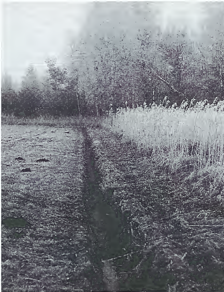
Abb. 3: Entwässerungsgraben als typisches Überwinterungsquartier für juvenile Erdkröten sowie Bergmolche und Grasfrösche. Aufnahme am 4.2.1993, einige Tage nach der Räumung des Grabens.

Mehrere adulte Bergmolche entdeckte ich Anfang März im Kurpark von Bad Buchau in Hohlräumen unter großen Steinplatten. Einige weitere Molche beobachtete ich etwas später mitten im Ried. Letztere müssen den Winter in Seggenhorsten oder im Boden verbracht haben. Auch die Wasserfrösche überwinterten teilweise terrestrisch: Anfang April 1993 entdeckte ich zwei adulte Tiere im Schilfröhricht nahe des bereits erwähnten Schwimmbeckens von Oggelshausen; sie waren offensichtlich gerade erst aus der Winterruhe erwacht, denn eines der Tiere war zum größten Teil noch im Bodengrund vergraben.