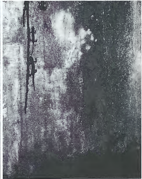
Abb. 4: Kellerfensterschacht der Federsee-station; Überwinterungsquartier zahlreicher Bergmolche, Teichmolche, Grasfrösche und Erdkröten. Mehrere Bergmolche und ein juveniler Grasfrosch klettern bei nächtlicher, naßwarmer Witterung die Wand empor.

A drainage ditch as a typical hibernation place for juvenile common toads, alpine newts, and common frogs. Photo taken on February 4, 1993, some days after drainage clearance.