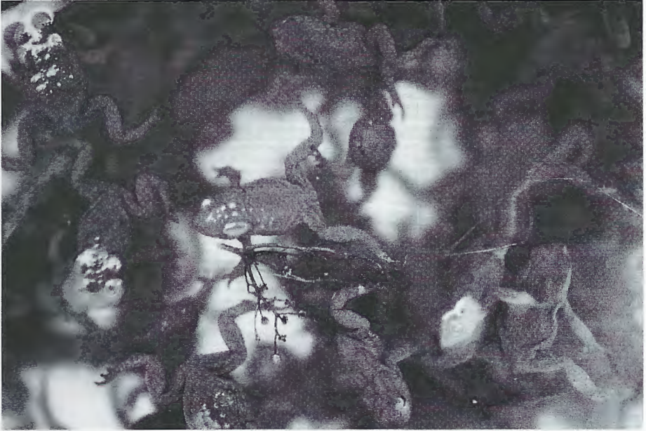
Abb. 2: Wasserüberwinternde juvenile Erdkröten im Fanggefäß am 9.3.1992. Aquatically overwintering juveniles of the common toad in a trap on March 9, 1992.

mert, die ebenfalls dort überwinternten. Im gleichen Gewässer entdeckte ich auch mehrere, bereits im Januar aktive Bergmolche, einen juvenilen Wasserfrosch sowie im Februar 1994 eine überwinternde Wasserfroschlarve, die allerdings nach zwei Monaten im Aquarium verendete. Auch in anderen Tümpeln und Teichen beobachtete ich überwinternde Gras- und Wasserfrösche, sowie Bergmolche und deren Larven.