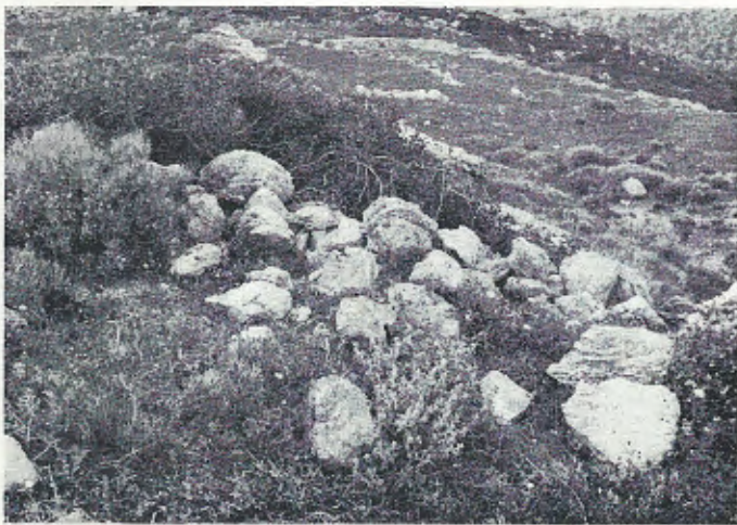
Abb. 6. Lebensraum der Katzennatter, Telescopus fallax intermedius n. subsp., auf Antikythira. Unter diesem Steinhaufen wurde die Katzennatter gefangen.

Im Vergleich mit den anderen, von uns besuchten Kykladeninseln trafen wir die Johannisechse, Ablepharus kitaibelii , auf Antikythira auffallend häufig an. Dieser Skink lebt immer dort, wo der Boden von Gras bestanden ist, und wo am Rande der grasigen Flecken niedrige Büsche ihm Zuflucht gewähren. Gerne sonnt er sich zwischen den Grashalmen, die ihn so hervorragend tarnen, daß man ihn erst wahrnimmt, wenn er dicht vor den Füßen mit schlängelnden Bewegungen blitzschnell davonhuscht. Wegen seiner Schnelligkeit ist der Skink außerordentlich schwer zu fangen. Sein Schwanz ist besonders empfindlich und bricht bei Berührung sehr leicht ab. Die Hauptaktivitätszeiten von Ablepharus kitaibelii scheinen morgens in den ersten zwei bis drei Stunden nach Sonnenaufgang und nachmittags ein bis zwei Stunden vor Sonnenuntergang zu liegen, denn zu diesen Zeiten kann man ihn am ehesten beobachten.