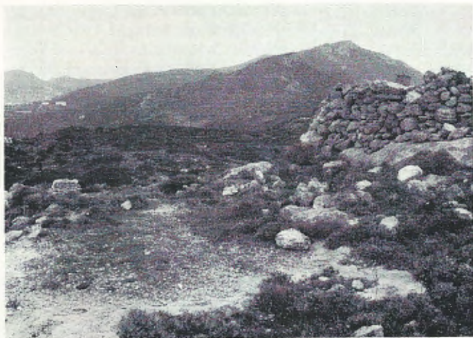
Abb. 2. Überall auf Antikythira, unter den Steinen, in den Büschen und in den Steinmauern lebt der Nacktfingergecko, Gymnodactylus k. kotschyi .

Gymnodactylus k. kotschyi is widely spread over the island of Antikythira, living underneath stones, in the bushes and in the stonewalls.