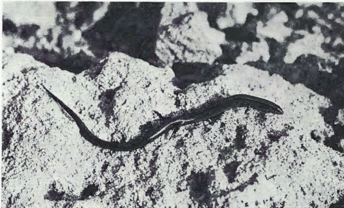
Abb. 3. Die Johannisechse, Ablepharus k. kitaibelii , von Antikythira. Ablepharus k. kitaibelii from Antikythira.

Der systematische Status der Halbfingergeckos von Antikythira ist eindeutig. Diese leicht verschleppbare Art (KAMMERER 1926, MERTENS 1934) gehört mit allen untersuchten Merkmalen (Rückenzeichnung, Kopf-Rumpflänge, Kopflänge und -breite, Schildchen zwischen den Nasenlöchern, Zahl der Supralabialia, Zahl der Infralabialia, Zahl der Rückentuberkel-Längsreihen, Abstand der Tuberkelreihen auf der Rückenmitte, Zahl der Oberschenkeltuberkel, Zahl der Präanalporen, Zahl der Fingerlamellen, Zahl der Zehenlamellen) zur Nominatform, die über die ganze Ägäis verbreitet ist.