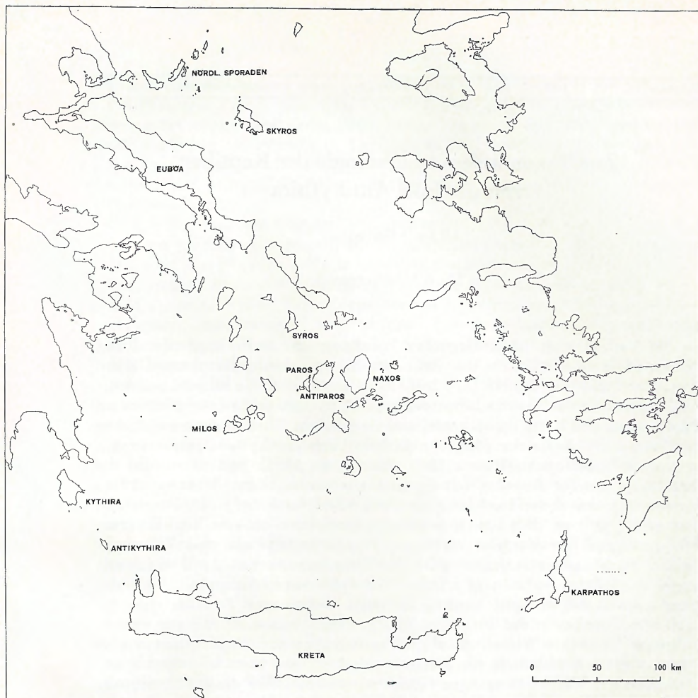
Abb. 1. Karte der Ägäischen Inseln.