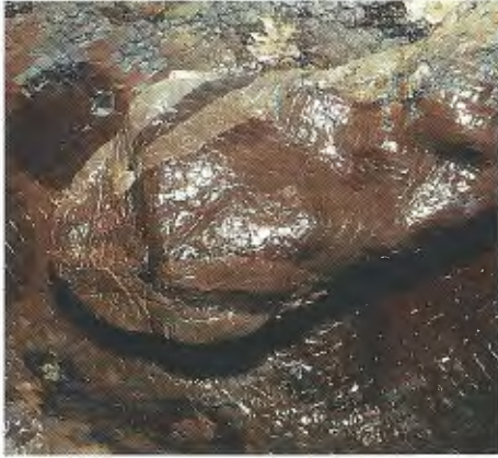
Abb. 1. E. murinus (CM 61619) aus Kolumbien ohne hellere Postocularregion.

E. murinus from Colombia without a lighter postocular region.