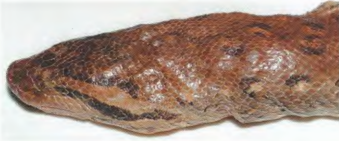
Abb. 5. Kopf des Holotypus von Eunectes barbouri . Head of the holotype of Eunectes barbouri .