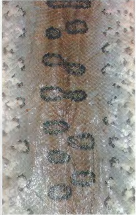
Abb. 7. Dorsale Ozellen des Holotypus von Eunectes barbouri Dorsal ocelli of Eunectes barbouri .