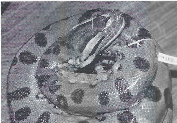
Abb. 8. Eunectes murinus (CAS 93200) aus Peru (Rio Calleria) mit dorsalen Ozellen.

Der einzige Unterschied liegt demnach in den dorsalen Ozellen anstatt der typischen schwarzen Punkte. Diese Farbvariante tritt jedoch mehr oder weniger stark ausgeprägt auch relativ häufig bei E. murinus aus den unterschiedlichsten Regionen und Ländern auf. Dieses Phänomen ist auch in PETZOLD's (1982) Buch „Die Anakondas“ deutlich auf den Photos (S. 51, Abb. 13 und S. 89, Abb. 24 u. 25) zu sehen. Oft ist nur der Halsbereich und das vordere Drittel als Ozellen zu erkennen, und die Ozellen gehen nach hinten in die typischen schwarzen Flecken über. Seltener sind sie bis zur Höhe der Kloake ausgeprägt oder sogar darüber hinaus – wie beim Holotypus – bis zur Schwanzspitze. Beispiele für Exemplare mit Ozellen aus verschiedenen Ländern sind: Bolivien: AMNH 104551, USNM 280966; Brasilien (Mato Grosso): AMNH 93558; Brasilien (Para): BMNH 1924.2.28.14, KU 32545, KU 124589, KU 129870, LACM 2117-2134, USNM 6000; Trinidad: BMNH 1950.1.5.90; Guyana: AMNH 14262, CM 60230; Kolumbien: AMNH 4138, FMNH 45692, MCV 42354-42356, MCV 46630; Peru: AMNH 53132, AMNH 54273, AMNH 55269, AMNH 55364, CAS 93200 (Abb. 8), LSUMZ 26869, LSUMZ 39427, SMF 59686; Surinam: BMNH 1946.4.4.11, MTKD D 14972, SMF 16886, SMF 16887, SMF 16889; Venezuela: AMNH 127827, AMNH 127829, BMNH 97.7.23.26, BMNH 97.7.23.27, ZSM 105/1990.