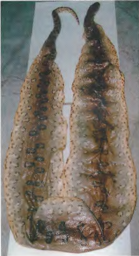
Abb. 6. Haut des Holotypus von Eunectes barbouri . Deutlich sind die Ozellen zu erkennen, die zur Artbeschreibung führten. Skin of the holotype of Eunectes barbouri . Notice the ocelli upon with the description of the taxon was based.