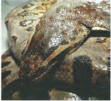
Abb. 2. E. murinus (FMNH 9504) aus Paraguay mit heller Postocularregion.

E. murinus from Colombia without a lighter postocular region.