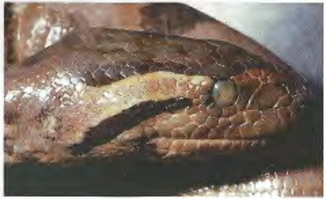
Abb. 4. E. murinus (MCZ 2563) aus Brasilien mit intermediärer Postocularregion.

E. murinus from Bolivia with a lighter postocular region.