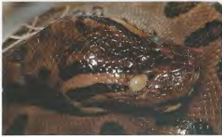
Abb. 3. E. murinus (USNM 280966) aus Bolivien mit hellerer Postocularregion.

E. murinus from Paraguay with a lighter postocular region.