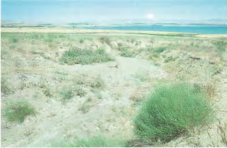
Abb. 7. Lebensraum von Eremias suphani 9 km südlich von Ahlat, 1650 m (Prov. Bitlis). Weitere Amphibien- und Reptilienarten: Bufo viridis , Testudo graeca , Lacerta media , Ophisops elegans , Trapelus ruderatus .

Habitat of E. suphani 9 km south of Ahlat, 1650 m (Bitlis prov.). Additional amphibians and reptiles: Bufo viridis , Testudo graeca , Lacerta media , Ophisops elegans , Trapelus ruderatus .