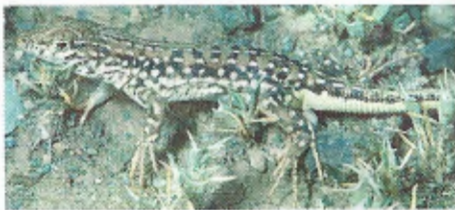
Abb. 2. Eremias suphani (westl. Özalp).

Neben der Zeichnung der Rückenmitte können wir noch zwei weitere Zeichnungsmerkmale anführen, welche die beiden Arten trennen. So weist Eremias suphani im unteren Flankenbereich eine Reihe großer, rundlicher, weißer Flecken auf, die meist scharf abgegrenzt sind und häufig zu einem breiten Ventrolateralband zusammenfließen (Abb. 2). Nur bei zwei der von uns untersuchten Exemplare (ZFMK 46319, ZSM 95/1957/1) erscheinen die Flecken eher verwaschen. Im Unterschied dazu sind die Ventrolateralflecken bei E. trauchi immer schmal bis strichförmig, beziehungsweise fließen zu einem schmalen Ventrolateralband zusammen, das undeutlich gegen die dunklere Lateralfärbung abgesetzt ist (Abb. 3). Ein weiterer Unterschied betrifft die dunkle Querbänderung, die bei E. suphani auffallend regelmäßig ausgeprägt ist. Bei E. trauchi sind dagegen häufig sowohl die Bänder selbst, als auch deren Abstände unterschiedlich groß. Dabei kann die dunkle Lateralzeichnung aus kleinen, isolierten Flecken bestehen, aber auch aus unregelmäßigen, unterbrochenen Längsbändern. Zuletzt sei noch auf die bei beiden Arten