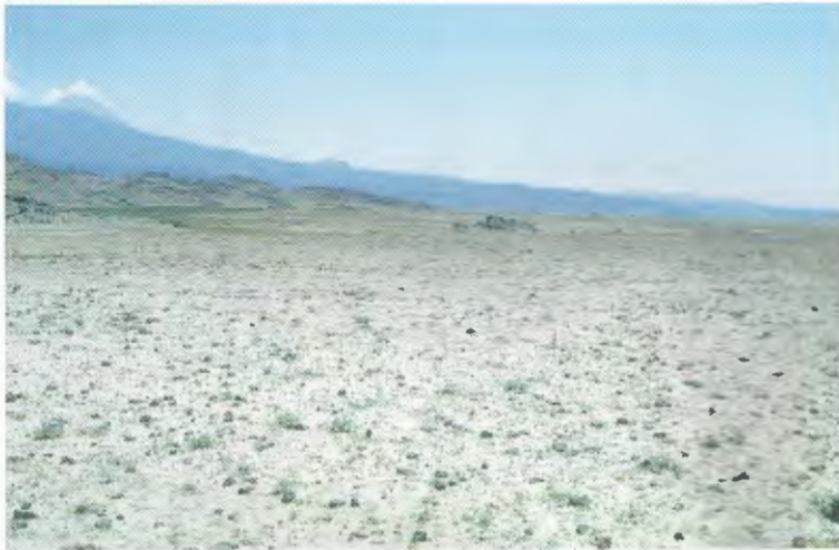
Abb. 6. Lebensraum von Eremias trauchi nordöstlich von Karabulak, 1500 m (Prov. Ağrı). Weitere Amphibien- und Reptilienarten: Pelobates syriacus , Bufo viridis , Eremias pleskei , Phrynocephalus helioscopus , Natrix tessellata ; im Bereich der Felsen Laudakia caucasia und Coluber schmidtii .

Habitat of E. suphani west of Özalp (Van prov.). Additional amphibians und reptiles: Bufo viridis , Rana ridibunda , R. macrocnemis complex, Ophisops elegans .