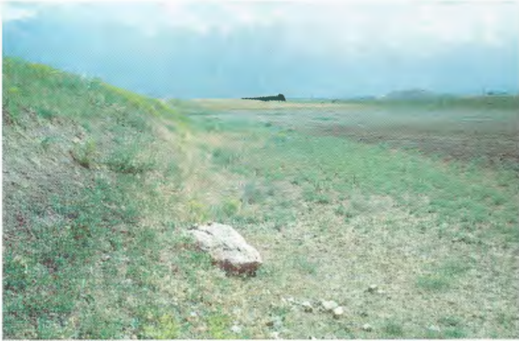
Abb. 5. Lebensraum von Eremias suphani westlich von Özalp (Prov. Van). Weitere Amphibien- und Reptilienarten: Bufo viridis , Rana ridibunda , R. macrocnemis -Komplex, Ophisops elegans .

Habitat of E. suphani west of Özalp (Van prov.). Additional amphibians und reptiles: Bufo viridis , Rana ridibunda , R. macrocnemis complex, Ophisops elegans .