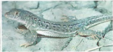
Abb. 3. Eremias trauchi (südl. İğdir).