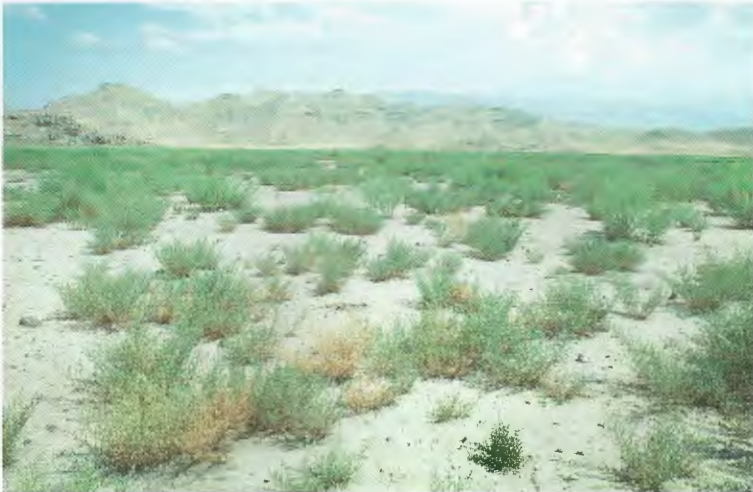
Abb. 8. Lebensraum von Eremias trauchi südlich von Iğdır, 800 m (Prov. Kars). Weitere Amphibien- und Reptilienarten: Pelobates syriacus , Bufo viridis , Eremias pleskei , Phrynocephalus helioscopus , Malpolon monspessulanus , Vipera lebetina .

Habitat of E. suphani 9 km south of Ahlat, 1650 m (Bitlis prov.). Additional amphibians and reptiles: Bufo viridis , Testudo graeca , Lacerta media , Ophisops elegans , Trapelus ruderatus .