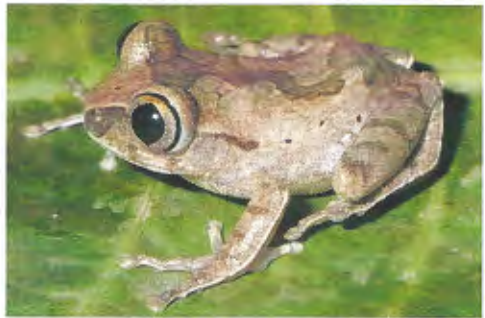
Abb. 3. Typische Waldfrösche, die im Lokoli Forest nachgewiesen wurden. Von oben: Hyperolius fusciventris burtoni , Weibchen, Hyperolius sylvaticus nigeriensis , Männchen und Leptopelis spiritus-noctis , Männchen.