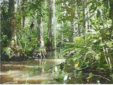
Abb. 2. Typisches Bild des überschwemmten Lokoli Forest.

Ein weiterer Hinweis auf das Fehlen von lange Zeit zurückgehenden Wäldern in diesem Bereich könnte auch die geringe Amphibiendiversität im Lama Forest sein, der ungefähr 20 km vom Lokoli entfernt liegt. Obwohl dieser erheblich intensiver untersucht worden und viel größer als der Lokoli ist (16.250 ha; LACHAT et al. 2006), beherbergt der Lama Forest ebenfalls nur 24 Anurenarten, von denen 14 Arten identisch mit der Lokoli-Fauna sind und die restlichen hauptsächlich aus Savannenarten bestehen (ULLENBRUCH 2003, eigene unveröff. Daten, siehe Anhang 2).